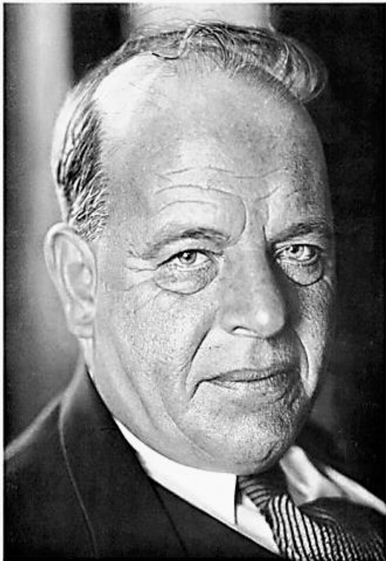
חיים נחמן ביאליק